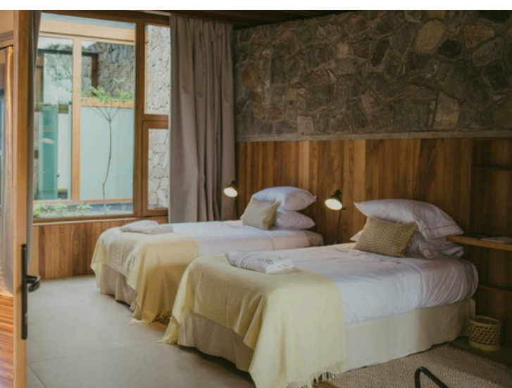
ENTRE PIRCAS (6)